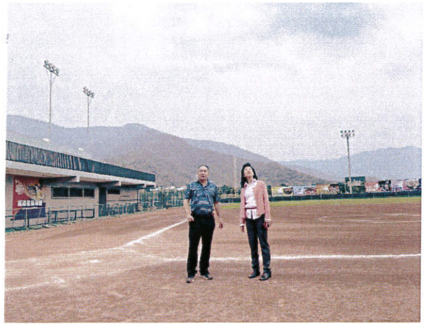
4/18(三) 16:00 參觀埔里福興壘球場