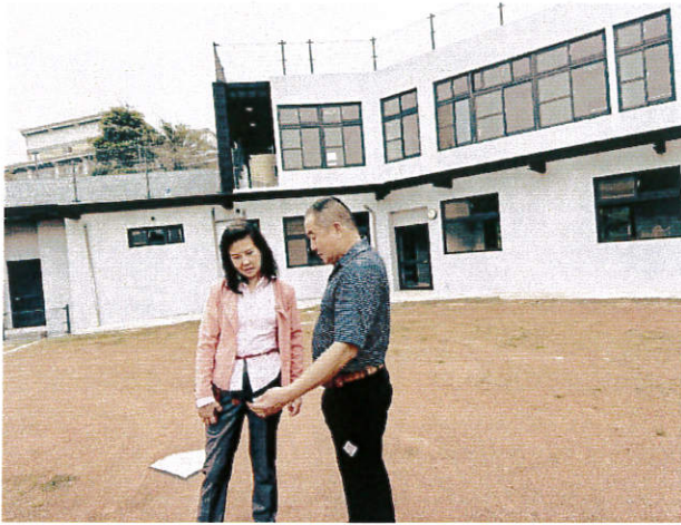
4/18(三) 15:00 參觀暨南大學壘球場