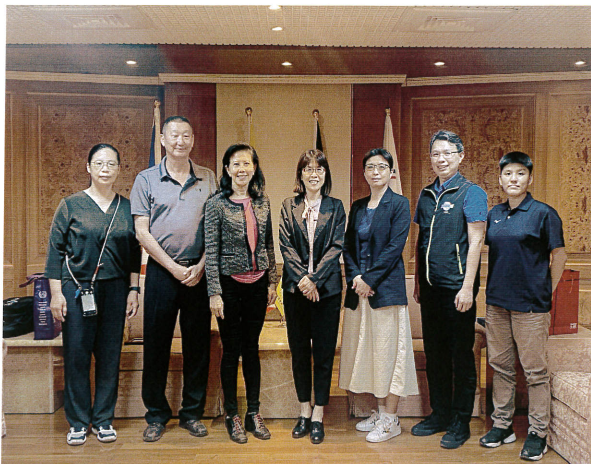
4/19(四)15:30 與教育部體育署國際組及競技組同仁合影