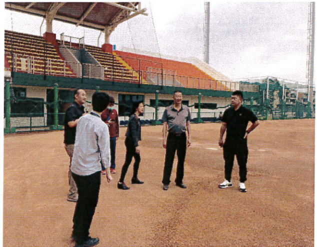
4/19(四) 11:00 參觀臺中國際壘球園區，由臺中市政府運動局介紹與接待